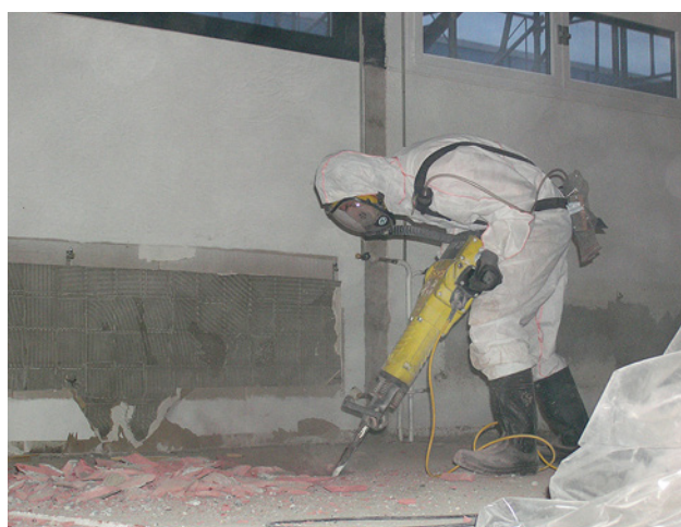
2 Pavimento rimosso con un martello demolitore