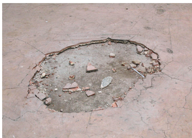
1 Pavimento in materiale composito a base di magnesite contenente amianto

Se si sospetta che la rimozione dei pavimenti in materiale composito possa causare un rilascio di fibre di amianto nell'aria, prima di iniziare i lavori è necessario determinare con precisione questo rischio.