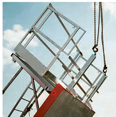
2 Braccio di sollevamento per il trasporto tramite gru di un'intera unità di cassetta