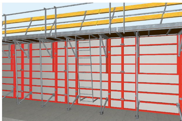
3 Casseratura a telaio con puntelli di stabilizzazione