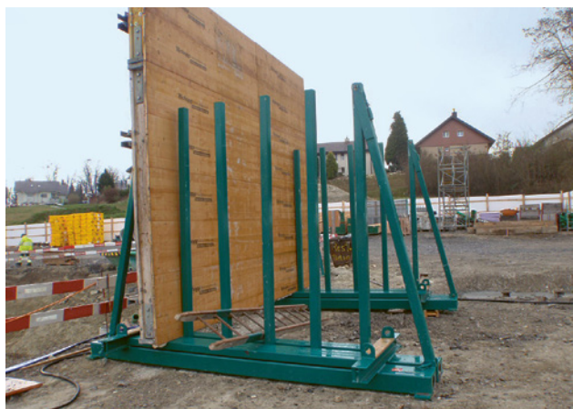
4 Stoccaggio in verticale su rastrelliera