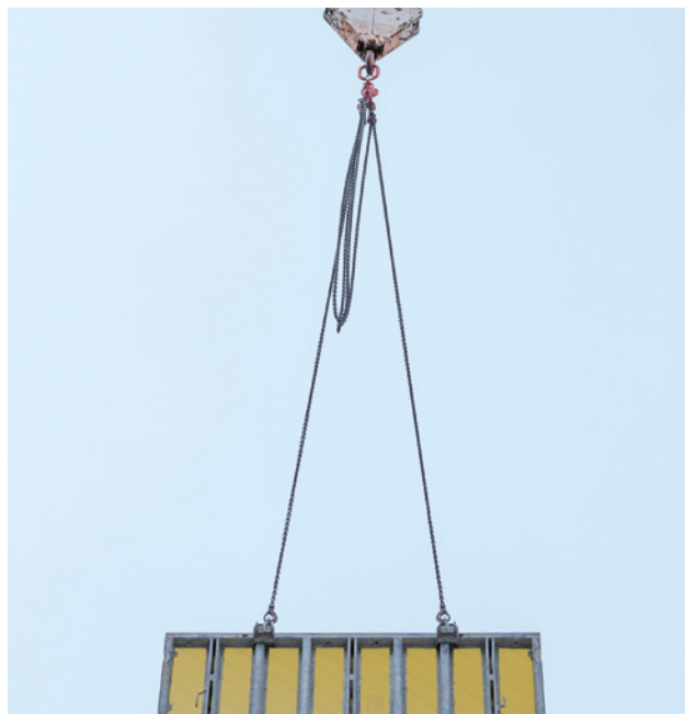
6 Trasporto di un elemento tramite gru con due ganci di sollevamento