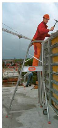
1 Lavori su un cassero per parete da una scala con piattaforma

I casseri modulari per pareti devono essere sempre messi in sicurezza contro il ribaltamento.