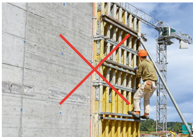
5 Vietato arrampicarsi sui casseri per pareti!