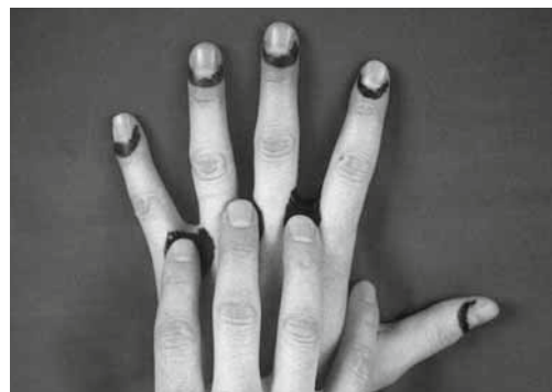
Figura 3: la crema per la cura e la protezione della pelle va applicata anche tra le dita.