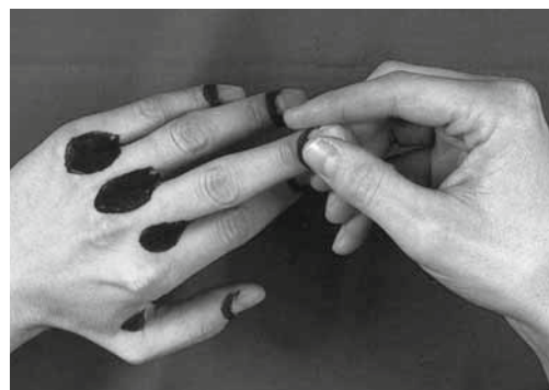
Figura 4: quando si protegge la pelle non bisogna dimenticare la zona attorno alle unghie.