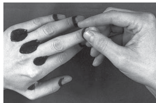
Figura 4: quando si protegge la pelle non bisogna dimenticare la zona attorno alle unghie.