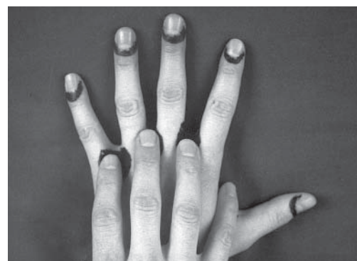
Figura 3: la crema per la cura e la protezione della pelle va applicata anche tra le dita.