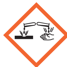
Figura 2: le sostanze classificate come «corrosive» possono provocare gravi danni al tessuto cutaneo. Proteggere la pelle, in particolare modo mediante l'uso di guanti idonei, diventa quindi una misura obbligatoria.