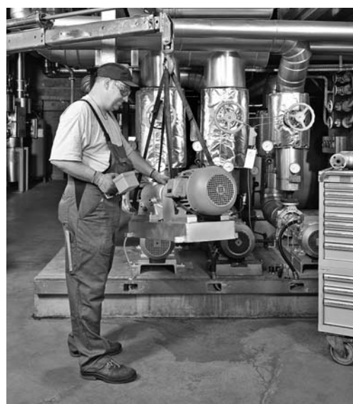
Fig. 2: il manutentore usa le attrezzature prescritte (in questo caso la gru).