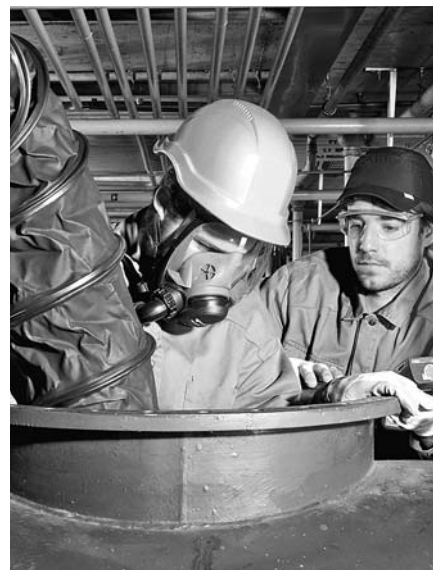
Fig. 8: ventilatore aspiratore installato per lavorare in una cisterna

È possibile che nella vostra azienda esistano altre fonti di pericolo riguardanti il tema della presente lista di controllo.