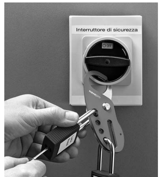
Fig. 3: interruttore per la revisione bloccato con il lucchetto personale e il dispositivo di chiusura multipla